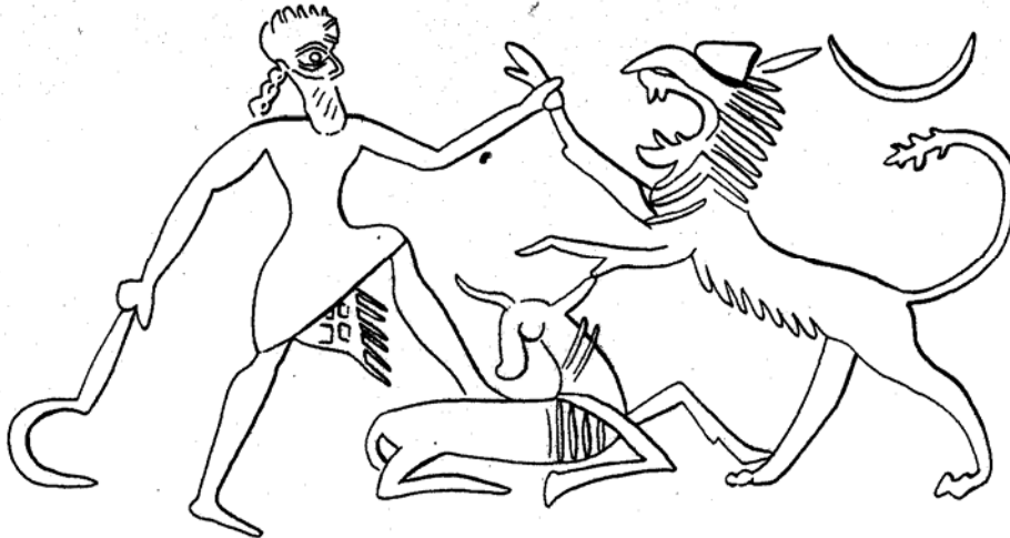
Abb. 2: Mensch als Beschützer, Nutznießer und „Herrscher“. Rollsiegel, neuassyrisch (9.-7.Jh. v. Chr.) aus: O. Keel, die Welt der altorientalischen Bildsymbolik und das Alte Testament , Zürich, Neukirchen 1972, 50.

geworden sind in den letzten Jahren freilich altorientalische Siegeldarstellungen, die zeigen, wie ein Hirt seinen Fuß auf ein Tier seiner Herde setzt und dieses damit vor einem angreifenden Löwen schützt.