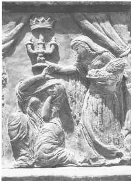
Die Menora vor der Knesset in Jerusalem (Ausschnitt), Rahel und Rut 1

Der Ehrenplatz Ruts unter den Müttern Israels hat Aufsehen erregt. Der Midrasch* Rut Rabba überliefert z.B. die Klage Davids: „Wie lange werden sie mich durch den Vorwurf erzürnen, daß sie sagen: Stammt er nicht von einer makelhaften Familie, stammt er nicht von der Moabiterin Rut ab?“ (Rut R 8,1). 2 Heißt es doch in der Tora*: „Kein Moabiter darf